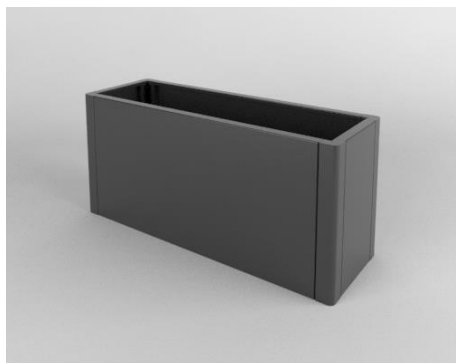
Fioriera mod. EMA