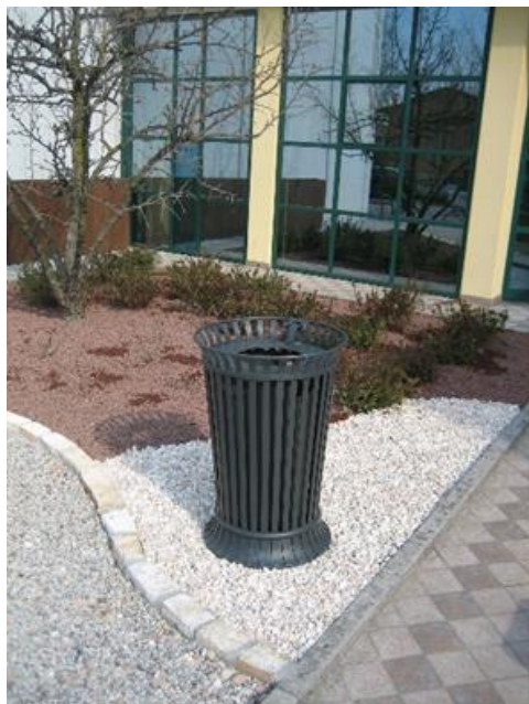
Cestino Mod. Fiore