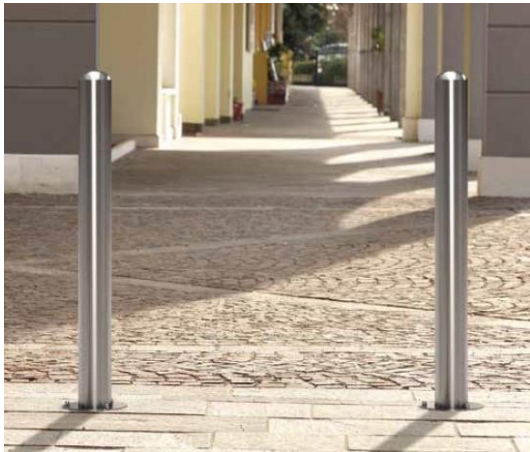
Dissuasore mod. NILO in acciaio inox AISI304 senza alette per aggancio della catena)